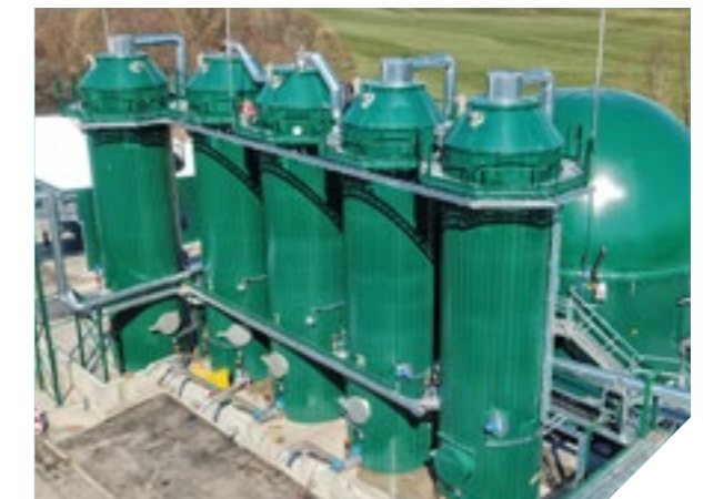
BioPV - Bioabfall-Presswasservergärung