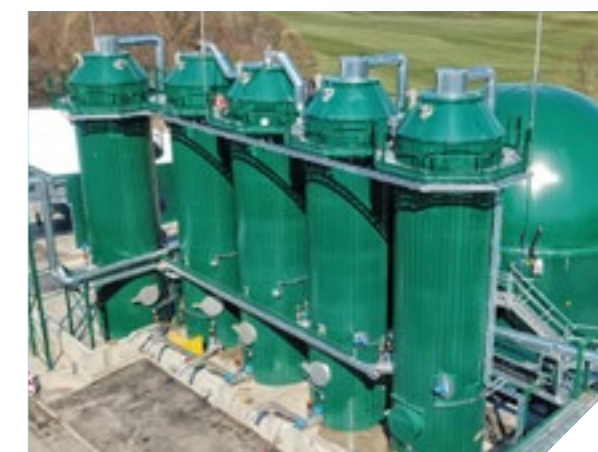
BioPV - Fermentarea deșeurilor bio cu apă sub presiune