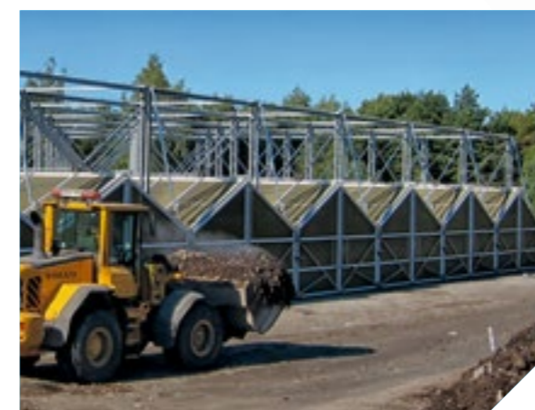
Biodegma - Tehnologie membrane