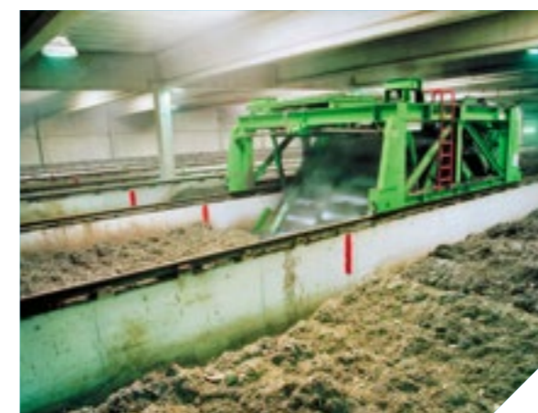
BioFIX - Compostarea pe rânduri