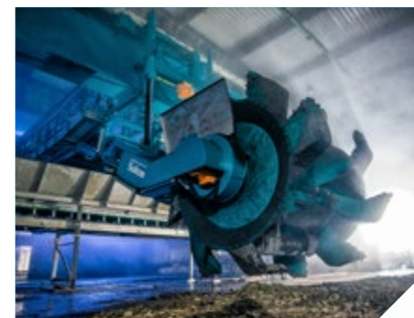
Wendelin - Compostare în stive plate

Fermentarea deșeurilor bio cu apă sub presiune